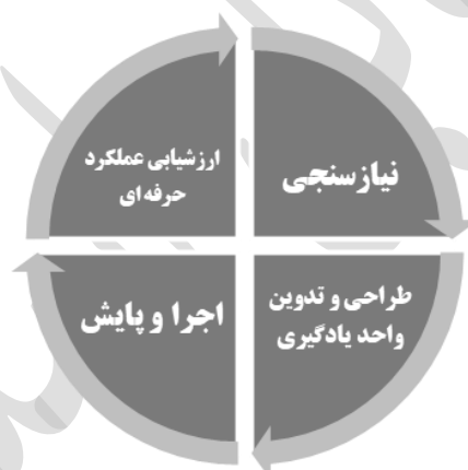
شکل شماره ۲: چرخه فعالیت کارآموزی

این فرایند شامل چهار مرحله است که عبارتند از: «نیازسنجی»، «طراحی و تدوین واحدهای یادگیری»، «اجرا و پایش» و «ارزشیابی عملکرد حرفه ای». شکل شماره ۱، چرخه فرایند کارآموزی را نشان می دهد: